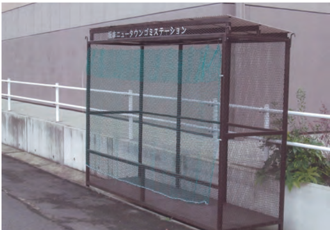
「第2区坂本ニュータウン」