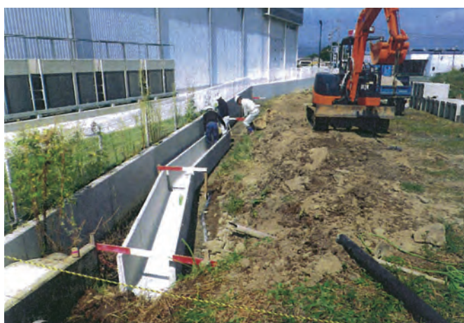
「堤下大堤用水改修事業」