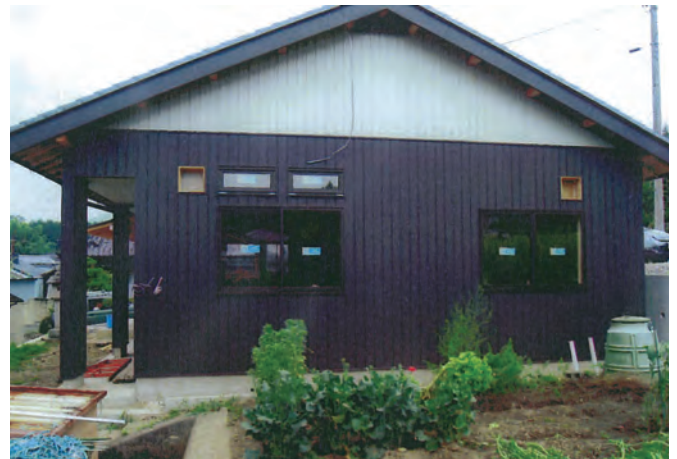
「第7区高齢者福祉サロン」