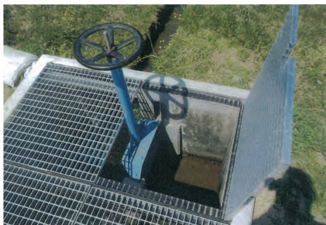
「第7区日影用水改修」