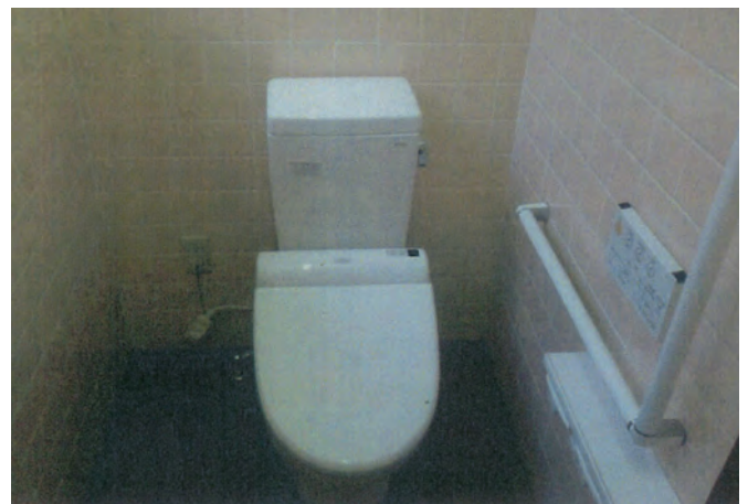
「第6区クラブ水洗化事業」