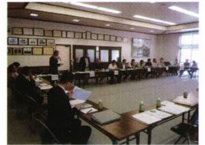
分割山代表者会議 (5月14日)