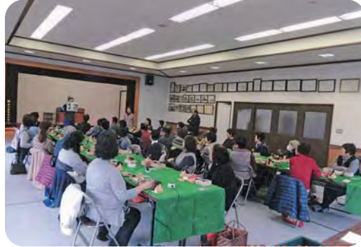
栗谷本先生の楽しい教室