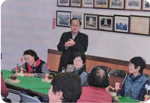
勝理事長あいさつ