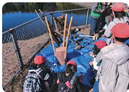
昔のはがね打ちの道具