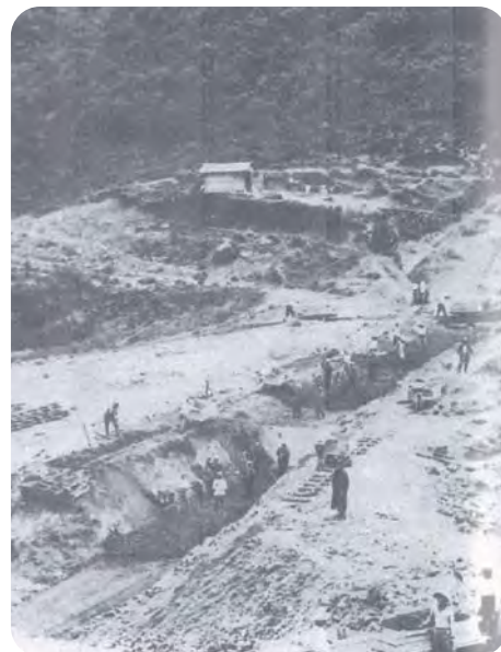
源根溜池工事風景