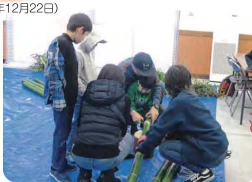
親子で仲良く門松作り