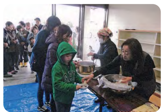
おいしいぜんざい