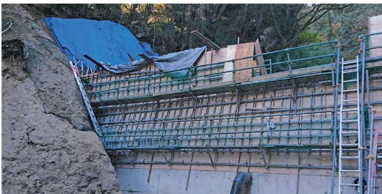
滝ヶ洞 治山堰堤工事