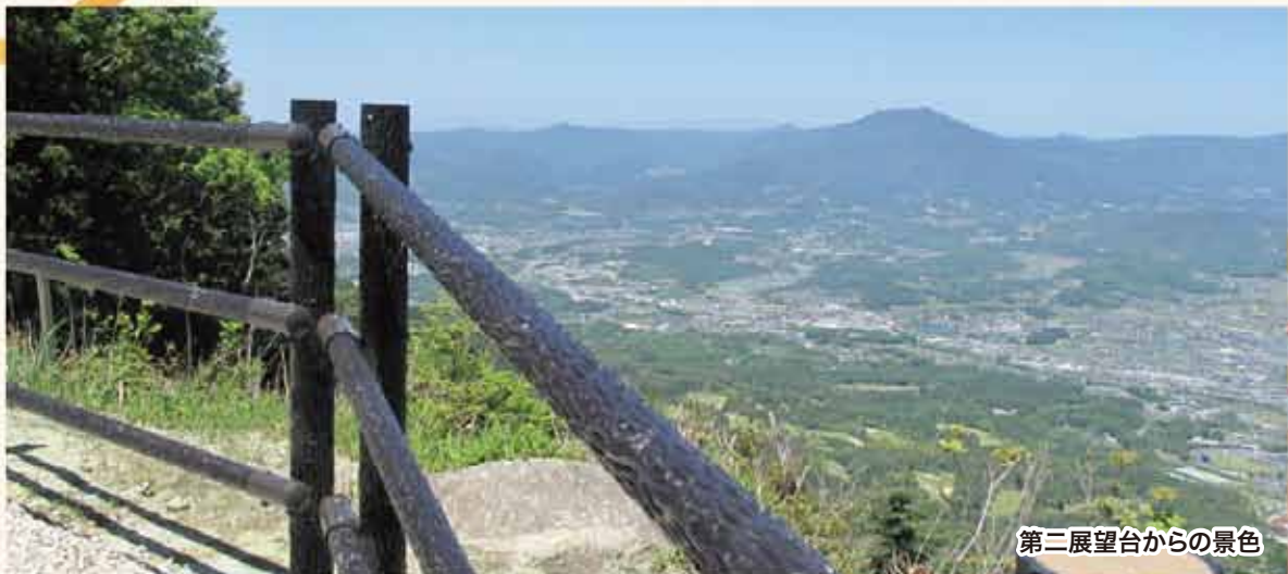
第二展望台からの景色