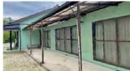
深沢町内会集会場壁塗替え工事