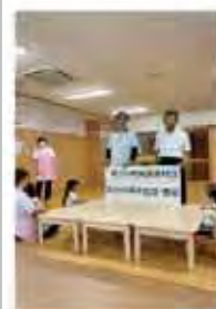
坂本さくら保育園