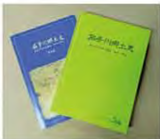
『茄子川郷土史』 概要版(左)と完全版(右)

一方、地球温暖化が地球沸騰化と呼ばれる事態に立ち至った高温化は、集中豪雨や干ばつの被害を世界各地にもたらしています。幸にしてこの地域は大きな被害を出す災害は起きていませんが、いつ発生してもおかしくない状況にあります。