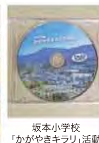
坂本小学校 「かがやきキラリ」活動 DVD