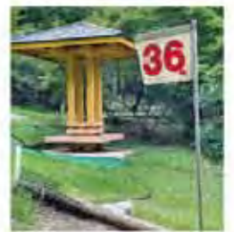
茄子川マレットゴルフ場 休息場の整備