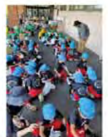
「命をつなぐ森づくり」への 協賛